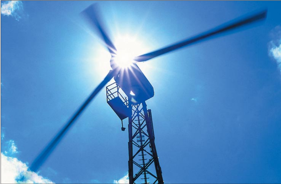
Stromeinspeisung, z. B. von den 2 000 Windenergieanlagen, kann im Netz der Eon Edis AG zur Überlastung kritischer Netzgebiete führen. Dem beugt ein Netzsicherheitsmanagement vor und vermeidet so Stromausfälle